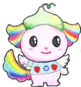
小山市の健康づくり キャラクターPちゃん

ご希望の方には 「開運おやま健康 マイレージ」のポイント カード、ポイントシール をお渡します。